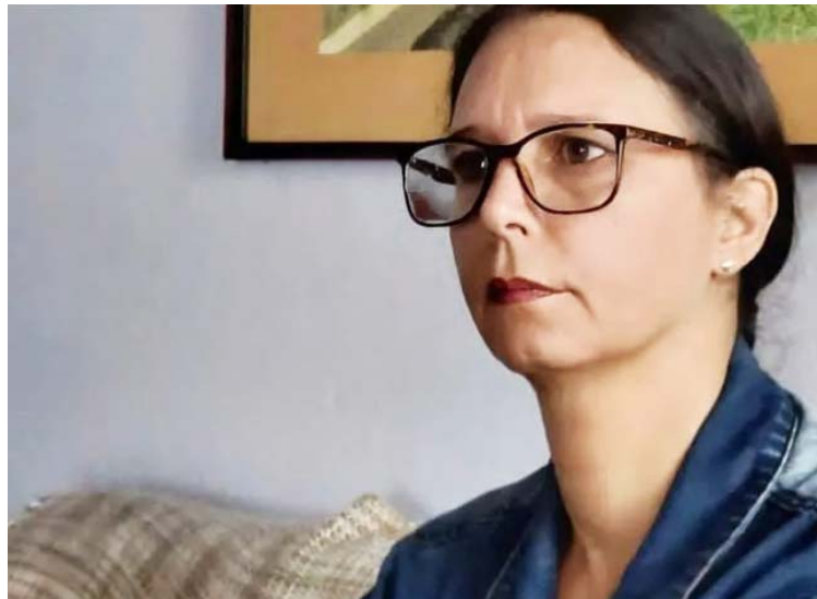
La autora fue directora de la Fundación Editorial El perro y la rana

De acuerdo con el veredicto, el jurado destacó la compilación de poemas “por su alta elaboración en el lenguaje, que es laboriosa y cuidada composición de imágenes poéticas cuya aleación