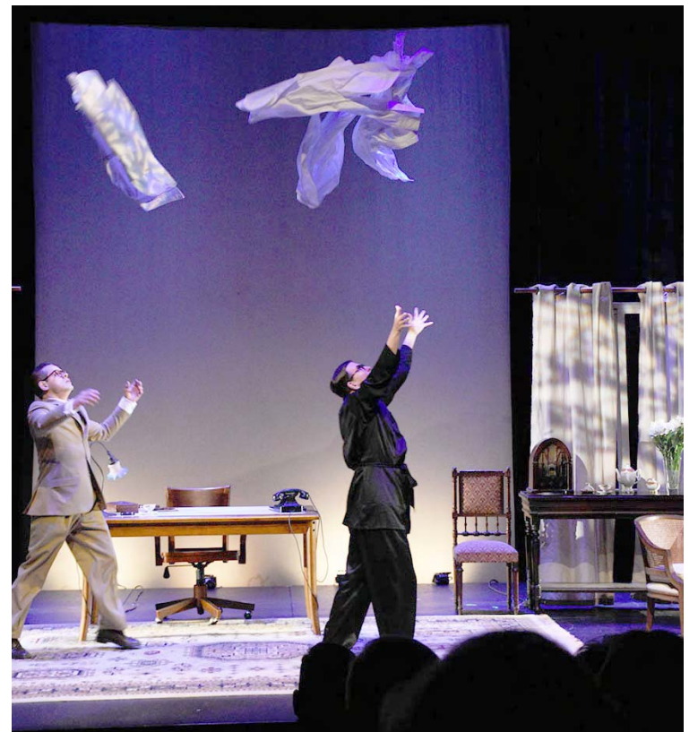
La obra mantiene la atención de principio a fin

Para esta función gratuita, desde las cinco de la tarde se abrirán los accesos de La Concha Acústica, mientras la función comenzará a las 7:00 pm. La seguridad está garantizada.