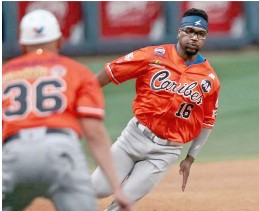
El caraqueño quiere establecerse en las mayores

“El beisbol te educa para la puntualidad”, expresa el toletero derecho. “Te enseñan a