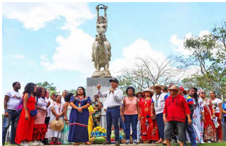
La manifestación rinde culto a la diosa María Lionza

T/ Redacción CO Caracas