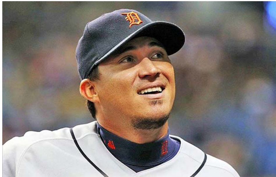
Ordóñez bateó .309 de por vida en las mayores

Por eso recaló que “esa teoría de que sólo con jonrones y dobles puedes anotar