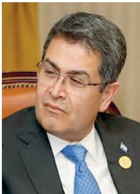
El expresidente Juan Orlando Hernández está preso en Estados Unidos acusado por narcotráfico.

Otro mandatario de derecha lo representa Daniel Noboa, el cual administra al Ecuador como si fuera una empresa de su padre, quien es el empresario más rico de su país. Uno de los mayores conflictos ha sido la ruptura diplomática con el gobierno de México, al invadir con la policía la Embajada de México y violar su soberanía. A la par de secuestrar al expresidente ecuatoriano, Jorge Glas, quien se encontraba asilado en esa sede diplomática. A la vez sus ajustes neoliberales en la economía del país del centro del mundo, ha hecho crecer al crimen organizado. Al respecto Gabriela Rivadeneira, ex presidente de la Asamblea Nacional de Ecuador, apuntó: “Hay dos grandes mafias mexicanas insertas en la dinámica de Ecuador y eso ha provocado la creación de al menos veinte grupos criminales que son ‘alimentados’ por estas. La influencia de esos dos grandes