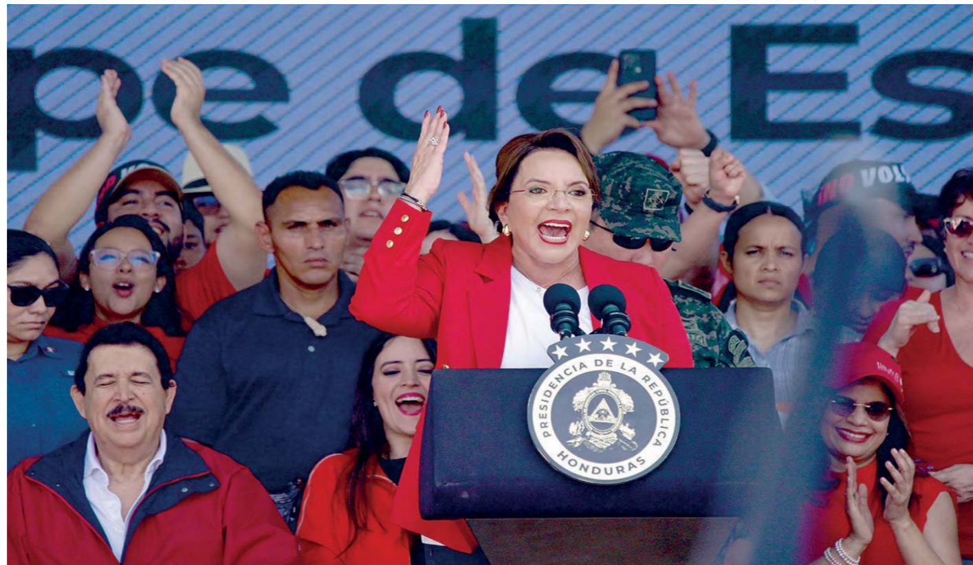
En tono alto Xiomara Castro confrontó el intento de golpe de estado y las injerencias estadounidenses en Honduras.

Además de inscribirse en el ininterrumpido intento de derrocar al gobierno venezolano e imponer un régi-