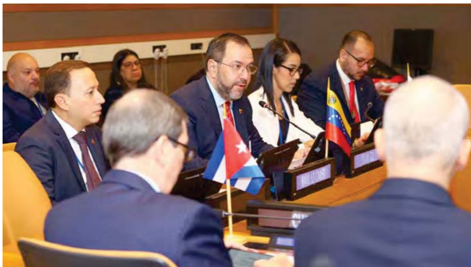
Yván Gil, Canciller de la República Bolivariana de Venezuela

“La humanidad se encuentra en momentos críticos, momentos de parto de una nueva historia, de surgimiento de un nuevo orden mundial más justo, más colectivo, más solidario, y como todo parto, el surgimiento de este nuevo orden mundial multipolar sin hegemonías que se imponen, es duro, es difícil, es doloroso (...) Son momentos en que los pueblos dignos, libres y soberanos del mundo nos enfrentamos a formas viejas y nuevas de agresiones, los fusiles y cañoneras del pasado hoy renacen en nuevas formas de agresiones”, denunció.