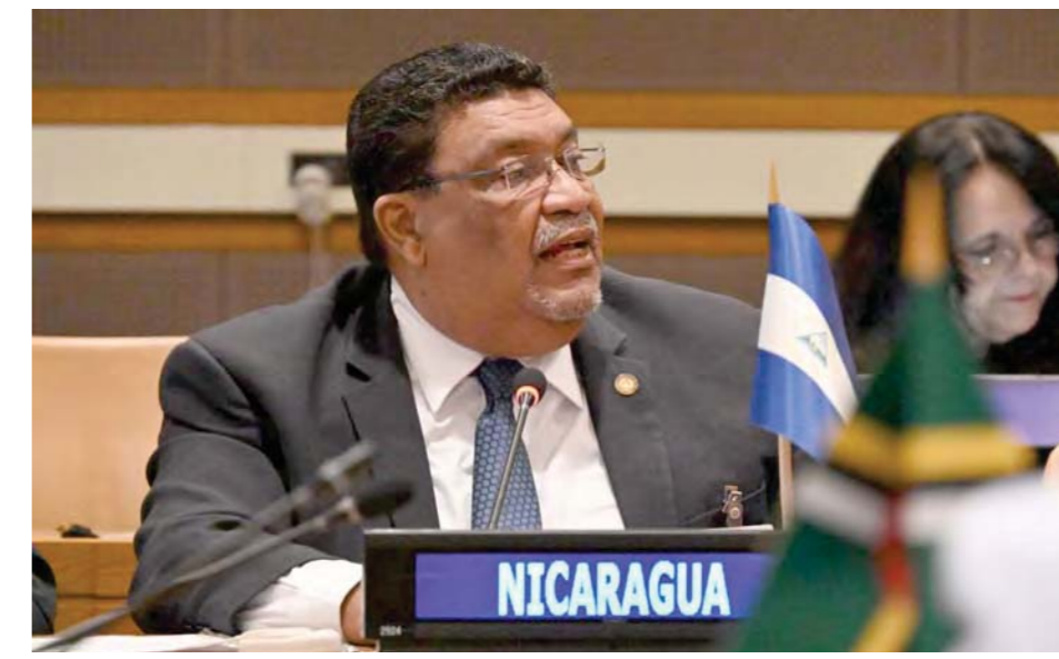
Ministro de Relaciones Exteriores de Nicaragua, Valdrack Jaentschke