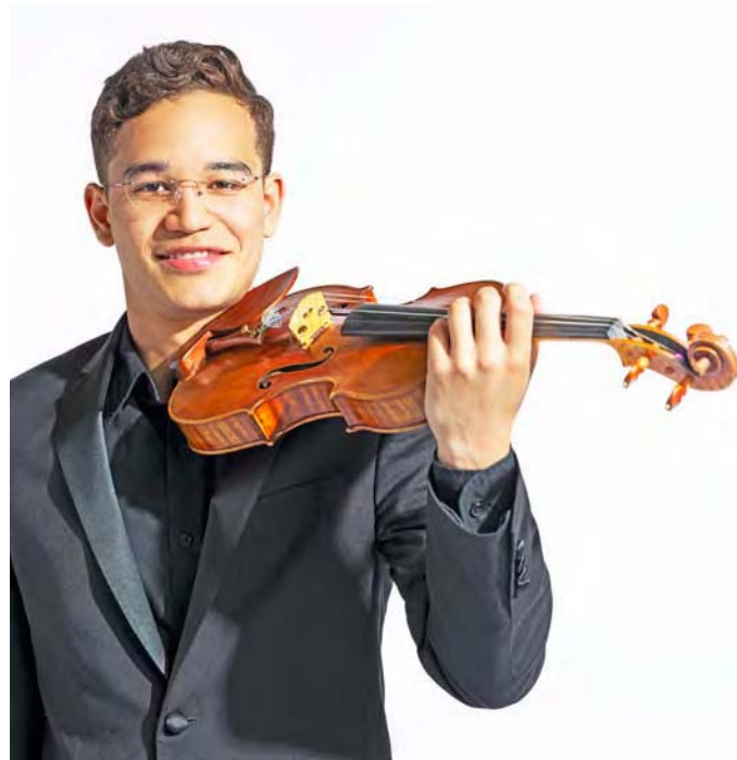
El de la tierra de los crepúsculos se destaca en la ciudad de los vientos

“Mi experiencia trabajando como fellow con la Orquesta Sinfónica de Chicago ha sido uno de mis más grandes sueños. Tener la oportunidad de tocar tres o cuatro conciertos semanales con una de las orquestas