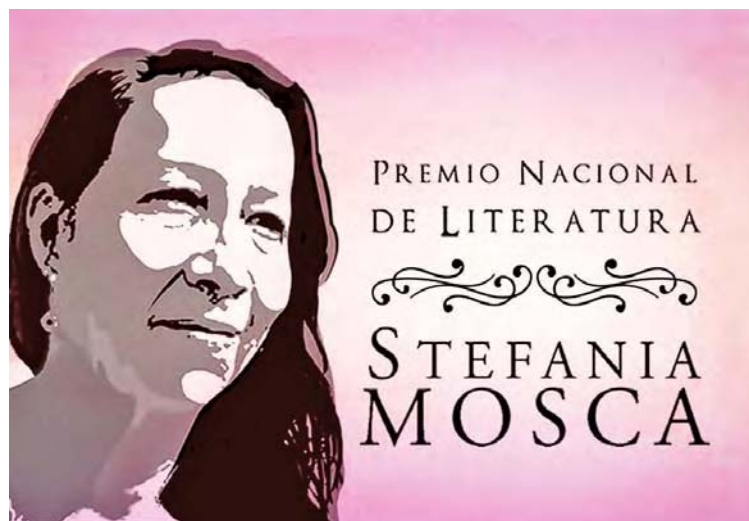
En el evento se presentaron los libros impresos ganadores en 2023

A criterio del equipo evaluador, la mejor crónica fue