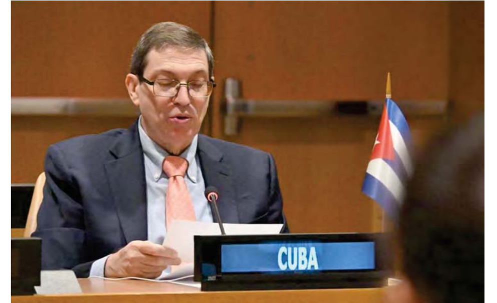
Bruno Rodríguez, ministro de Relaciones Exteriores de Cuba

A manera de ejemplo, el canciller citó a Venezuela que “enfrenta nuevamente el arsenal económico, político y mediático del imperialismo y el extremismo de derecha, dirigido a dinamitar su proceso