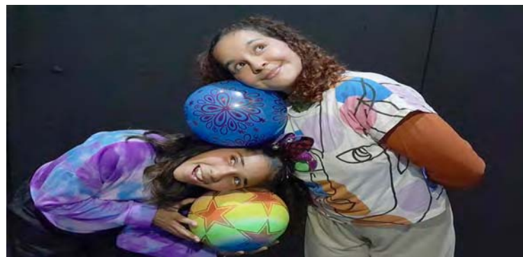
Las actividades tendrán lugar todos los fines de semana, hasta diciembre

Estas actividades se realizan como parte de la reactivación del Teatro San Martín de Caracas, regentado actualmente por la CNT, luego de realizar la rehabilitación, adecuación técnica, equipamiento y man-