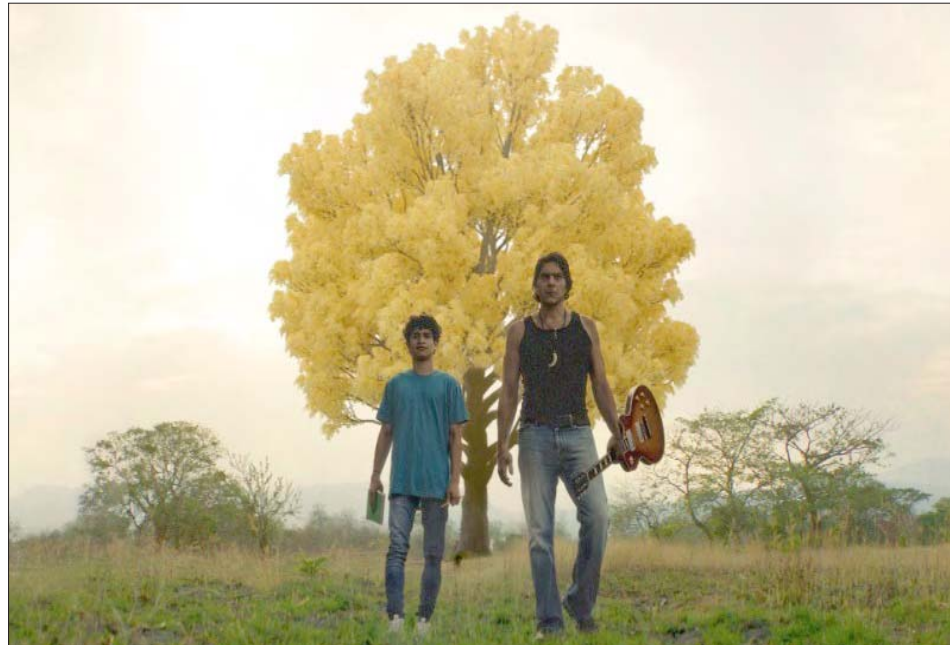
El trabajo obtuvo el premio de la prensa en el Festival de Cine Venezolano

Desde su estreno en el TCL Chinese Theater de Hollywood, como parte de la celebración del Festival Internacional