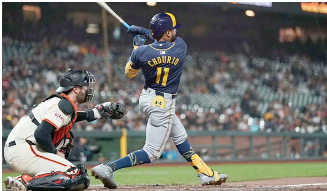
El vuelacerca veinte fue hacia la banda contraria

“Empecemos por lo inaudito de haberla sacado por la banda