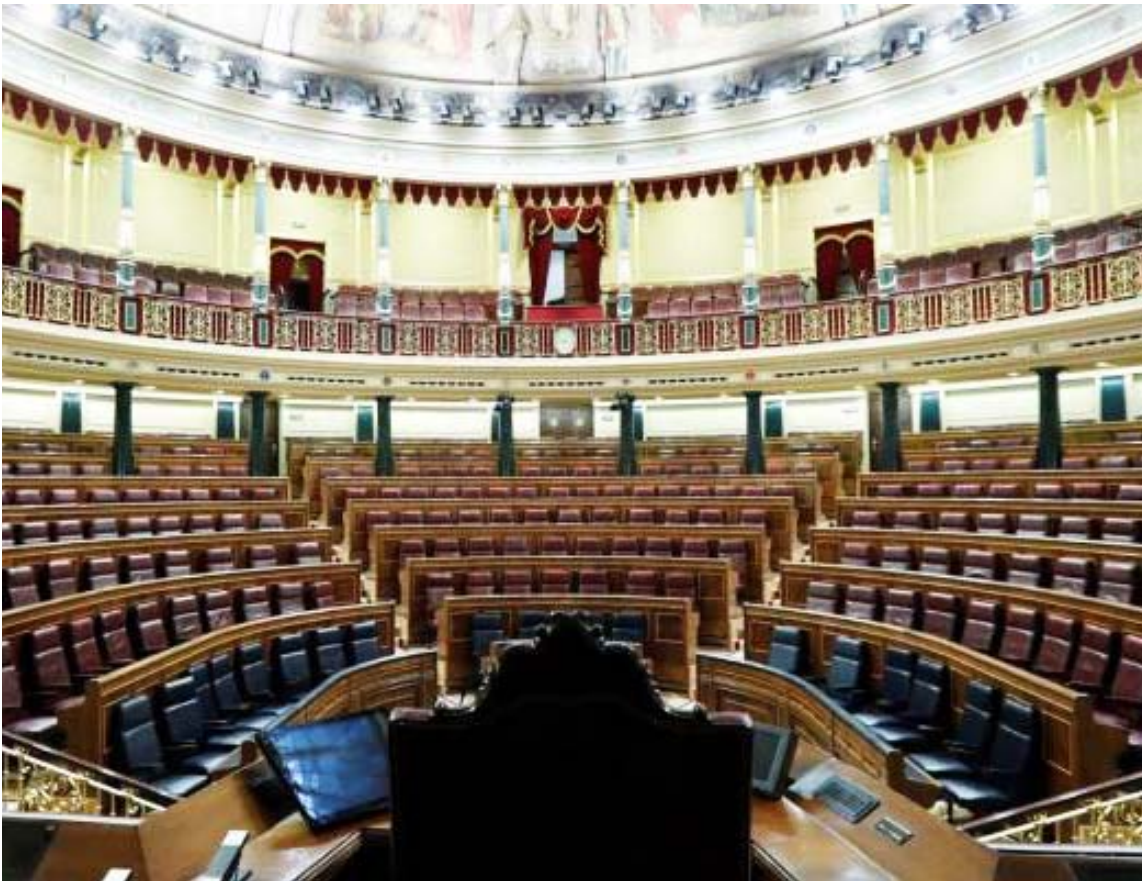
El presidente español Pedro Sánchez pospuso el reconocimiento de Edmundo González, a pesar de la solicitud del congreso

El Mandatario español también defendió la concesión de asilo a González como un “gesto de humanidad”, ante las críticas de sectores extremistas en Venezuela y España que cuestionan los acuerdos alcanzados con el Gobierno de Maduro para este proceso.