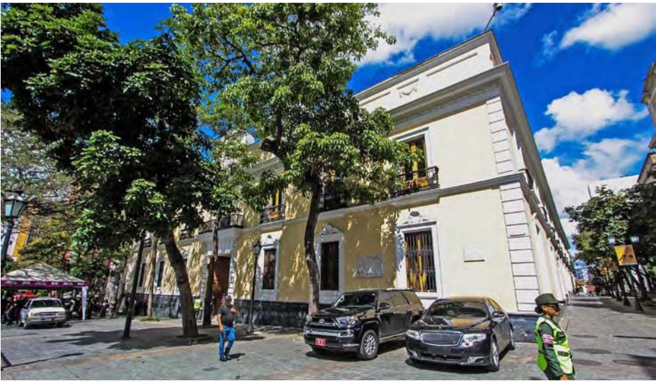
La Casa Amarilla, sede de la Cancillería venezolana

El Gobierno de Venezuela rechazó ayer las nuevas medidas coercitivas unilaterales impuestas por Estados Unidos (EE.UU.) a la presidenta del Tribunal Supremo de Justicia (TSJ), Caryslia Rodríguez, y a 15 representantes de varios poderes públicos, al calificarlas como un “nuevo crimen de agresión”. En un comunicado, la Cancillería venezolana aseveró que la inclusión de estos 16 funcionarios del Estado en la lista de la Oficina de Control de Activos Extranjeros (OFAC, por sus siglas en inglés), perteneciente al Departamento del Tesoro, demuestra un “total desprecio por el derecho internacional, la autode-