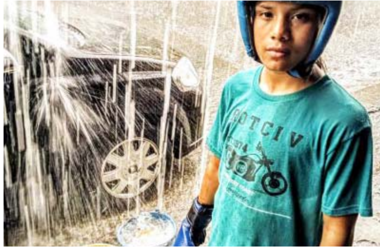
En los próximos días se anunciará la selección de cortometrajes en competencia

En la justa correspondiente a largometrajes de ficción ELCO premia las categorías de mejor película, ópera prima, dirección, dirección de arte, dirección de