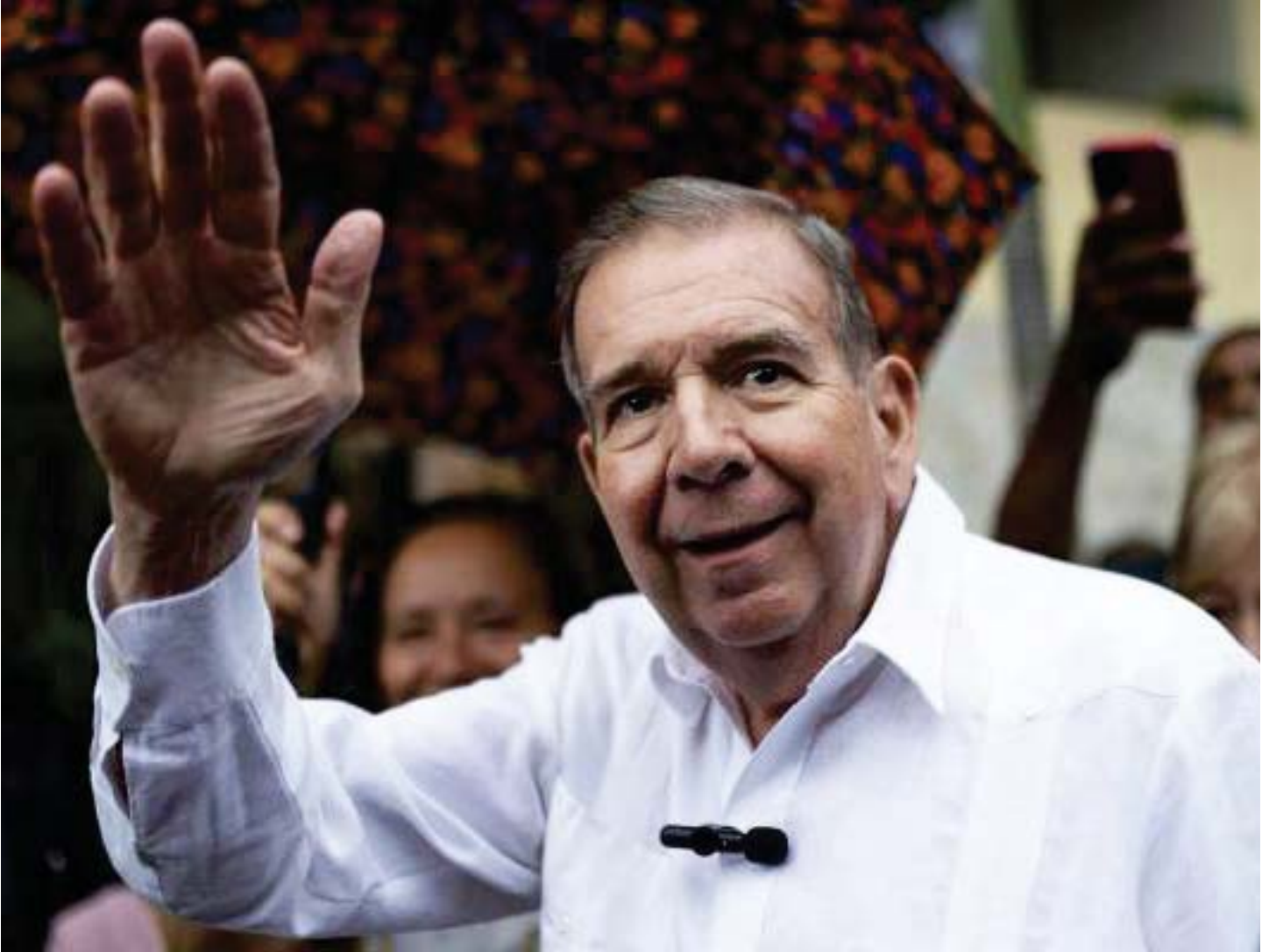
La salida de Venezuela de Edmundo González supuso un terremoto político para la oposición

En términos generales, el asilo diplomático como institución del Derecho Internacional solamente es aceptado por los países latinoamericanos, sobre la base de varios tratados especiales (Convención de La Habana sobre Asilo de 1928, Convención de Montevideo sobre Asilo Político de 1933, Convención de Caracas sobre Asilo Diplomático de 1954). No obstante, el derecho al asilo está amparado internacionalmente en el artículo 14 de la Declaración Universal de los Derechos Humanos y en la Convención de Ginebra sobre Refugiados de 1951.