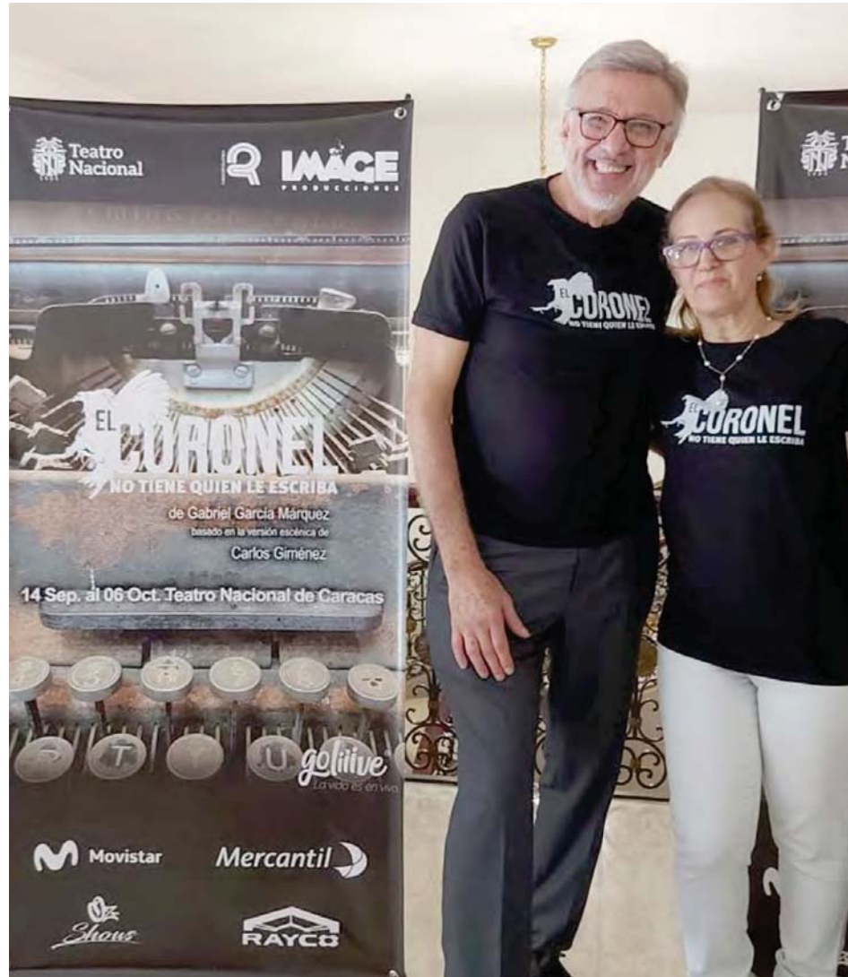
Es la primera vez que estos experimentados actores participan en la aclamada historia

En conversación con el Correo del Orinoco, el histrión insistió en que el Coronel es un personaje más desde el punto de vista de la preparación y construcción a nivel técnico y teatral en el trabajo de actuación. No obstante, desde el punto de vista emotivo, este nuevo reto implica para él un desafío y una gran responsabilidad de hacer el quinto coronel en la historia de la pieza. “Todo quien se me acerca para decirme ‘¿vas a hacer el coronel?’ y les digo ‘sí, voy a hacer el coronel. Pero estoy haciendo también el lobo de Caperucita ’. Cada papel lo hago con mucha responsabilidad”, remarcó.