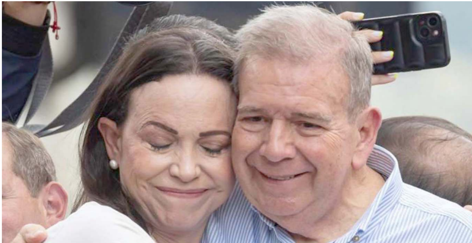
María Corina Machado y Edmundo González Urrutia

El comunicado de Edmundo González Urrutia desde Madrid, capital de España, lugar de su autoexilio, puede leerse como una continuación de la carta enviada al Fiscal General de la República y como un giro de 180° a su postura mantenida durante la campaña electoral y la jornada golpista post-28J.