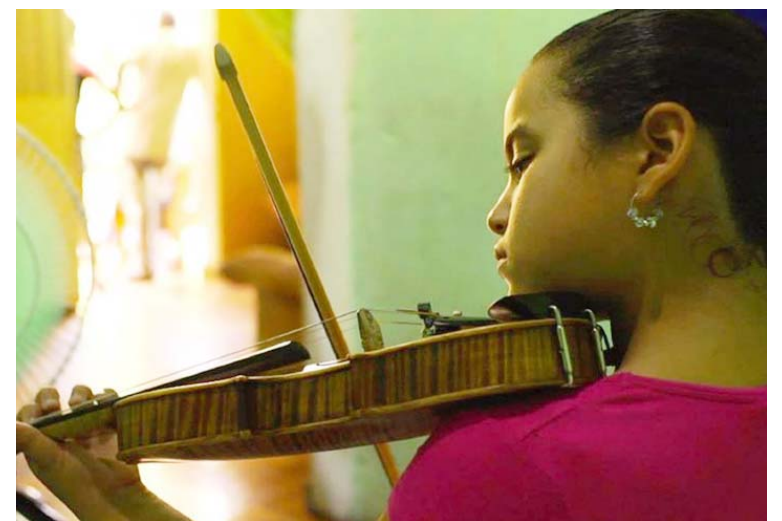
Es un trabajo que muestra que al arte fortalece al ser humano

La Academia Venezolana de Cine aclaró que existió una participación grande y entusiasta votación por parte de los cineastas venezolanos, miembros activos de la Academia, pertenecientes a las diferentes ramas del quehacer cinematográfico nacional, radicados en Venezuela y en diferentes países del mundo como Colombia, México, Argentina, Chile, Perú, España, Francia, Portugal, Italia y Estados Unidos, entre otros: “Agradecemos la participación masiva de los