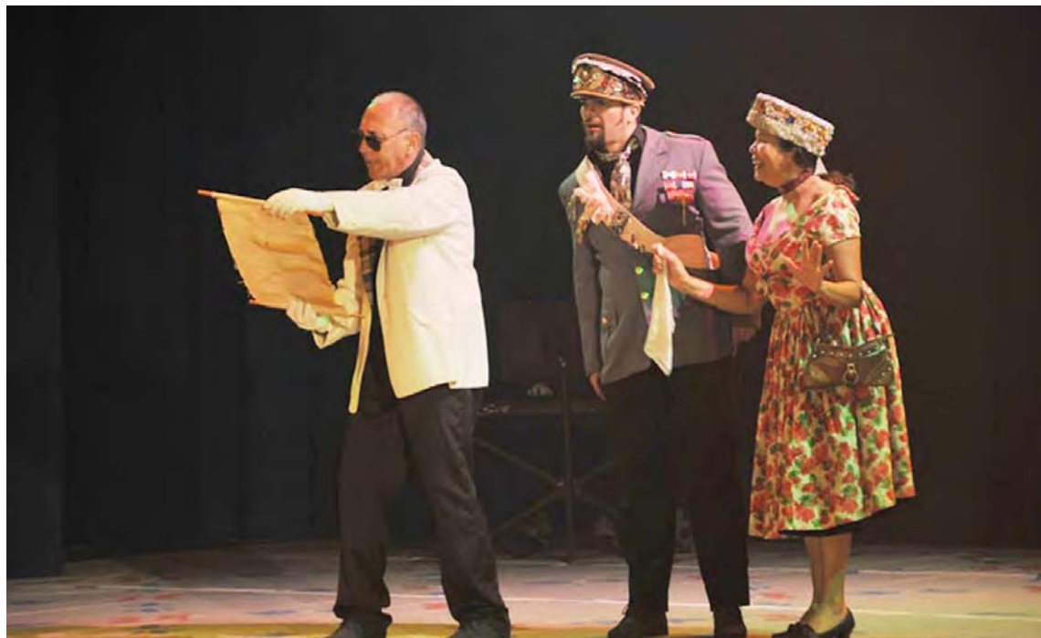
Este trabajo nos recuerda los populares sainetes del siglo pasado