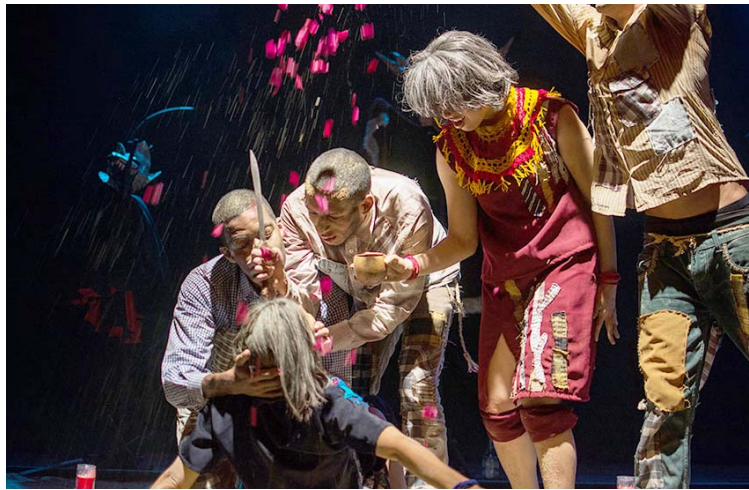
Para intentar un buen teatro debe haber una gran formación

En esta edición, se realizará un total de 14 actividades formativas, que comenzaron con el Taller de montaje “El verso Hecho Cuerpo”, dictado por Jericó Montilla. A su vez, se realizarán siete eventos especiales entre conversatorios, y perfor-