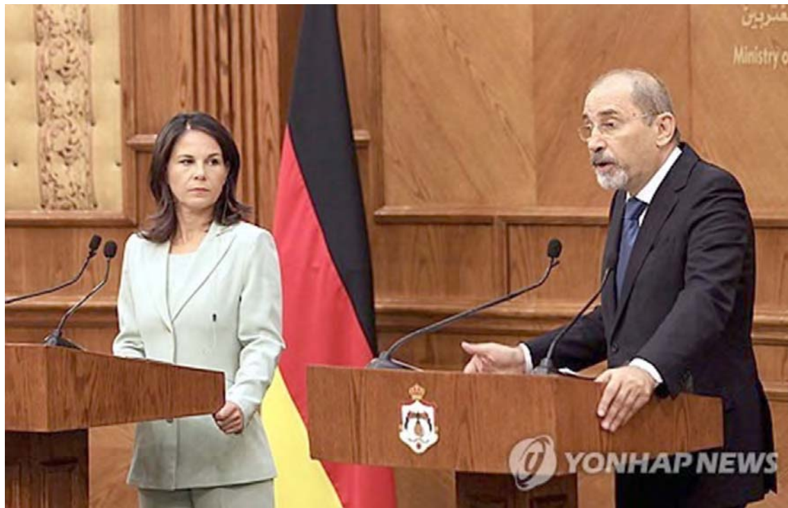
El canciller jordano, Ayman al-Safadi (a la derecha.) con su par alemana Annalena Baerbock

Al hacer referencia a la mayor incursión de Israel en Cisjordania ocupada durante casi las dos últimas décadas, el can-