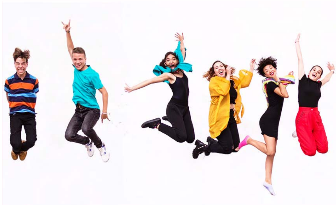
La iniciativa agrupa siete mini montajes de talentos emergentes