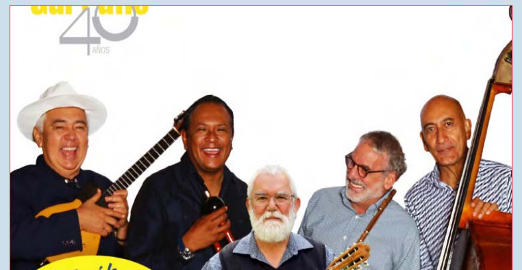
Luego de visitar Europa, el conjunto tocará en escenarios venezolanos

Además de los integrantes fundadores, la noche contará con la participación de invitados especiales, entre ellos el reconocido flautista y compositor venezolano Omar Acosta, un aliado cercano del Ensam-